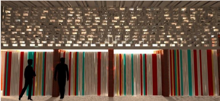
Entwurf: Yu Mou und Huifang Zhang Entwurf: Francesca Bozza und Manon Alinat